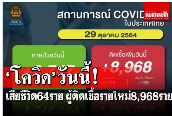
โควิด'ขาลงต่อเนื่อง! เสียชีวิต64ราย ผู้ติดเชื้อรายใหม่8,968ราย

เว็บไซต์ : https://www.naewna.com/local/612138