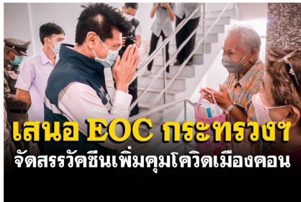
'สาคิต'เตรียมขง 'EOC' สธ. พิจารณาจัดสรรวัคซีนเพิ่มคุมโควิดเมืองคอน

เว็บไซต์ : https://www.naewna.com/local/612143