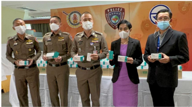
แก๊ง “ยาฟาวิพิราเวียร์” อ่อหมายเรียกเจ้าของ รพ. คลาย ข้อสงสัย สั่งซื้อออนไลน์

เว็บไซต์ : https://www.thairath.co.th/news/local/bangkok/2230246