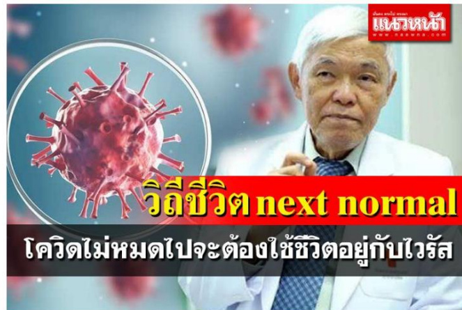
'หมอยง'ชี้โควิดผลักดันให้เกิดวิถีชีวิตnext normal เชื่อไม่หมดไปจะต้องอยู่กับไวรัส

เว็บไซต์ : https://www.naewna.com/local/612140