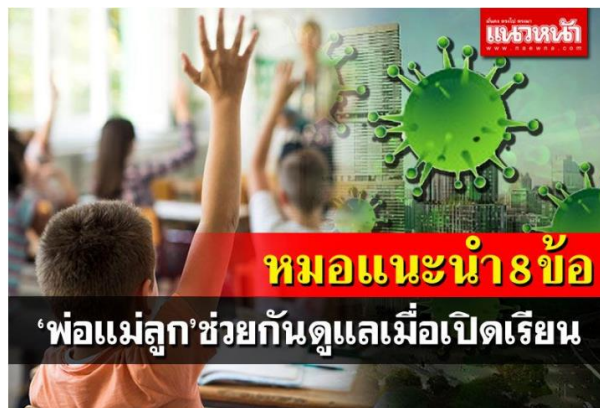
'หมอ'แนะนําสื่อ'พ่อแม่ลูก'เมื่อเปิดเรียน ท่ามกลางโควิดที่ระบอดยังรุนแรง

เว็บไซต์ : https://www.naewna.com/local/612148